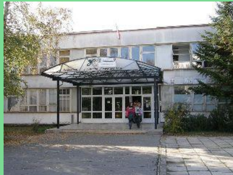
Gymnázium Jozefa Lettricha, Martin